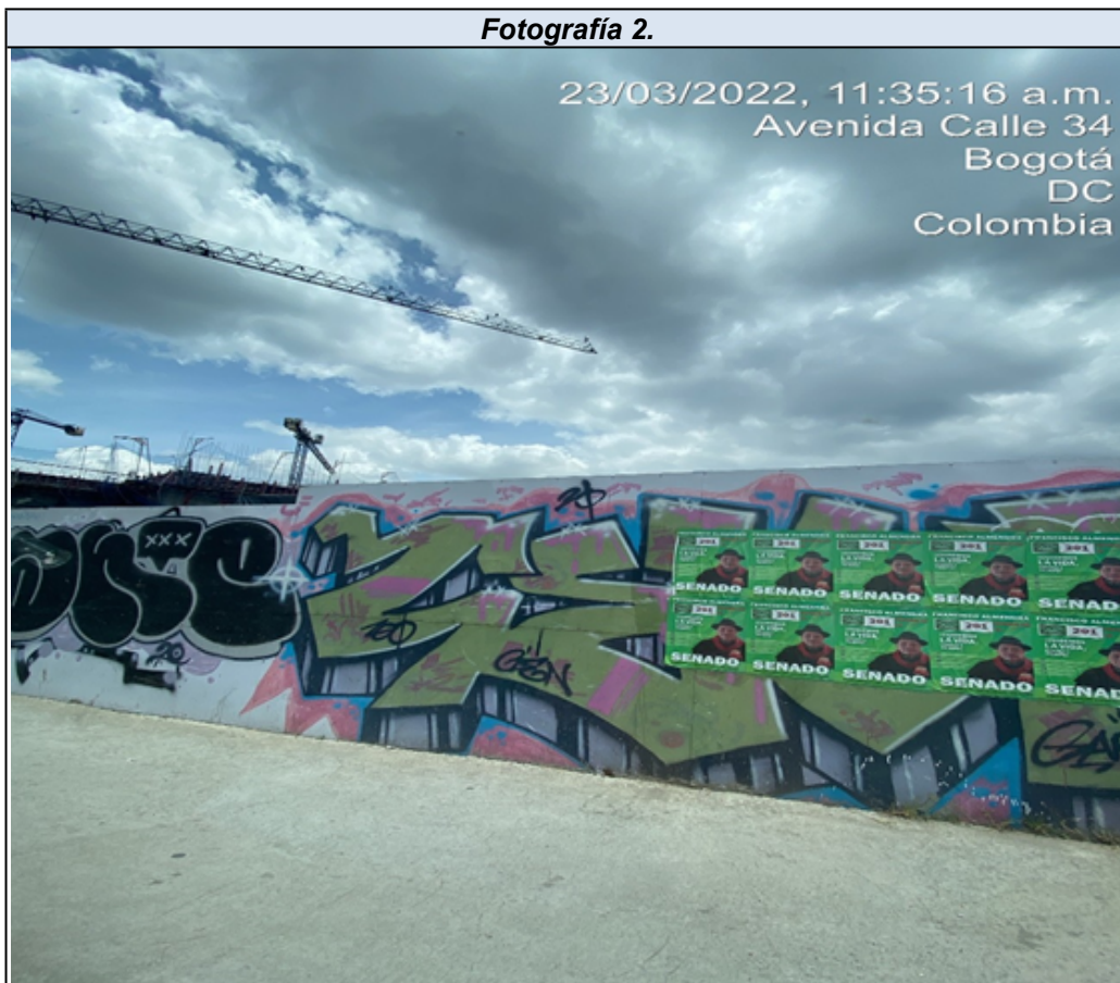
Foto panorámica sobre la AC 25 donde se evidencian diez (10) afiches instalados.