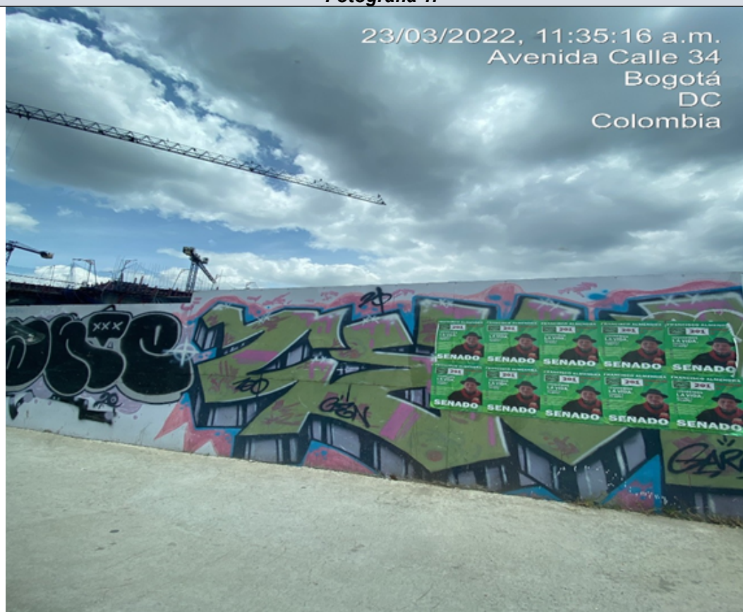
Foto panorámica sobre la AC 25 donde se evidencian diez (10) afiches instalados.